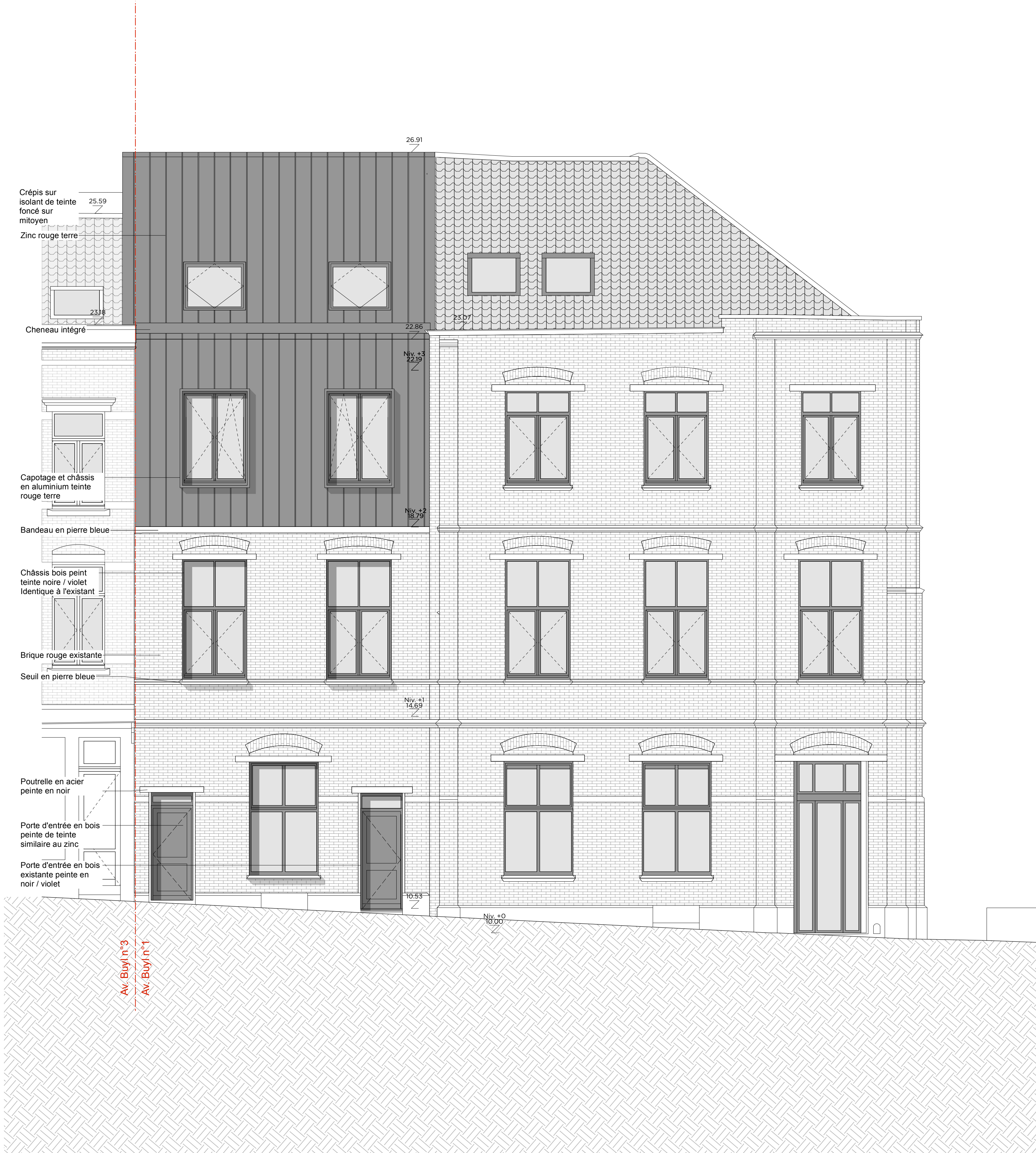
FACADE AVENUE BUYL