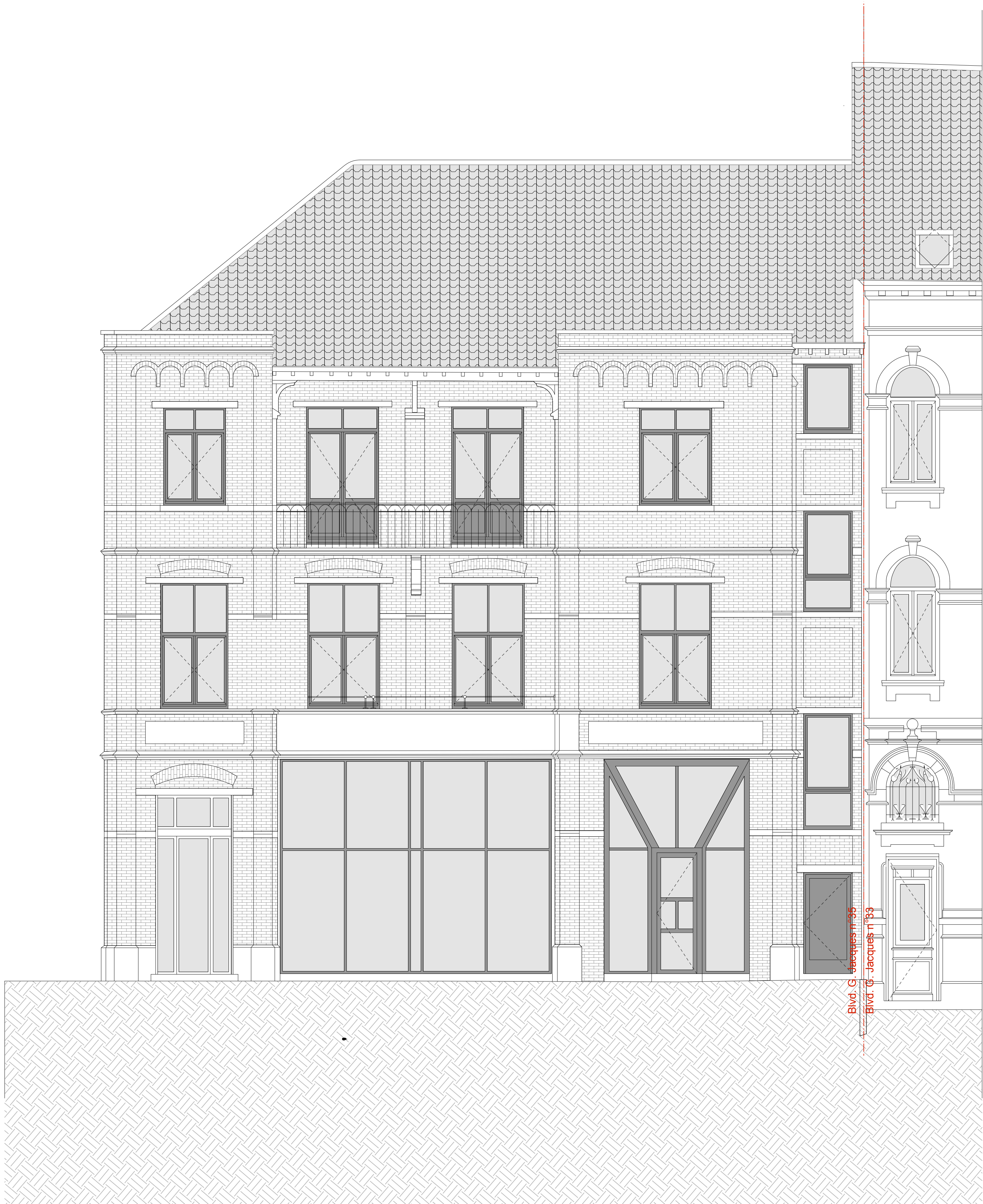
FACADE BOULEVARD GENERAL JACQUES